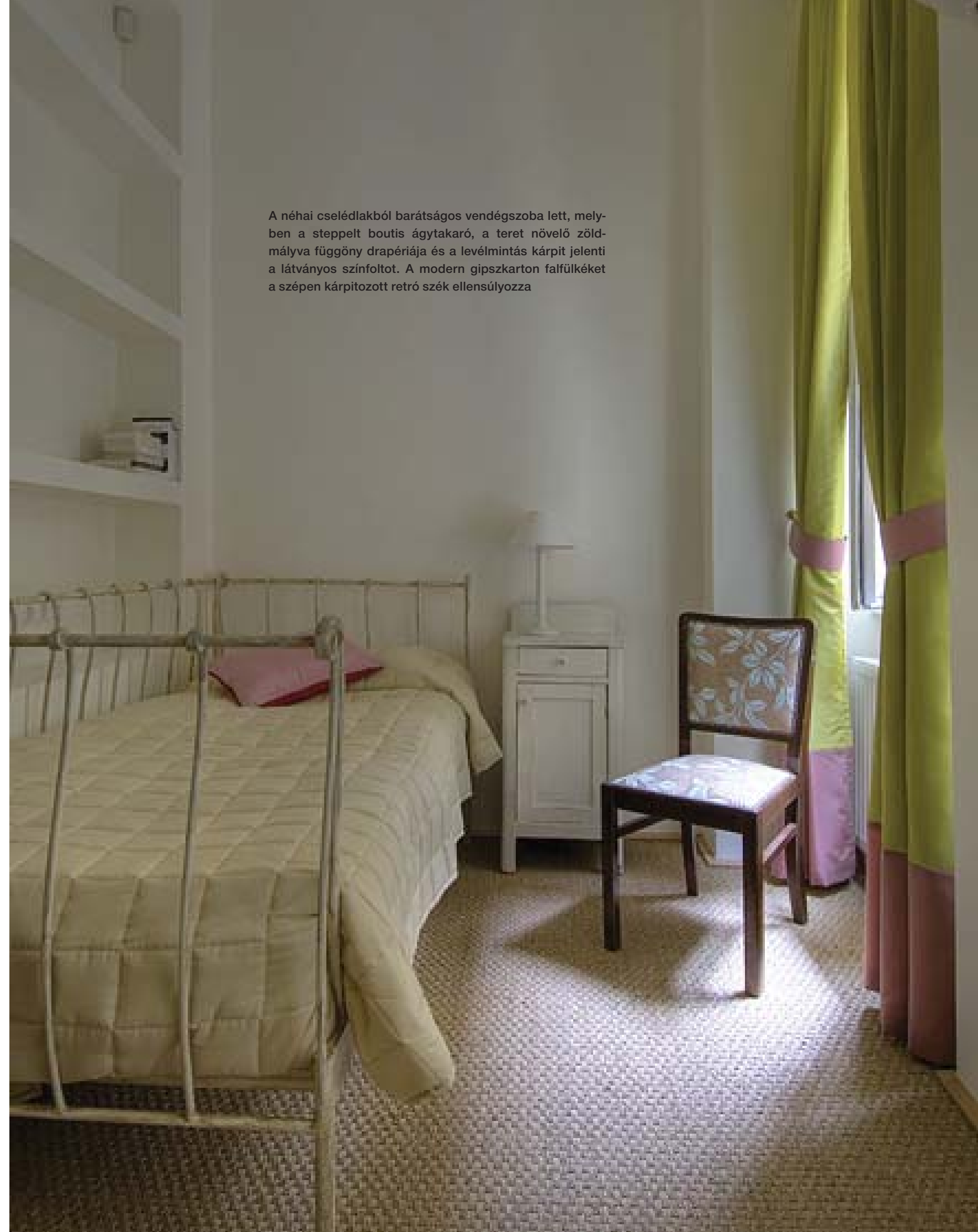
A néhai cselédlakból barátságos vendégszoba lett, melyben a steppelt boutis ágytakaró, a teret növelő zöldmályva függöny drapériája és a levélmintás kárpit jelenti a látványos színfoltot. A modern gipszkarton falfülkékkel a szépen kárpitozott retró szék ellensúlyozza